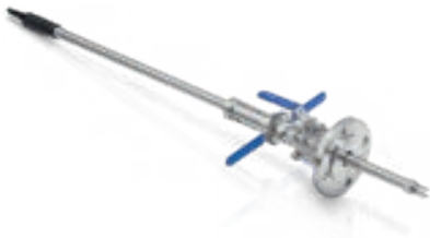
SENSOFIT RET 5000* For harsh chemical and water treatment applications, length up to 700 mm/27.6"