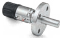
SENSOFIT RET 5810 For harsh chemical and water treatment applications