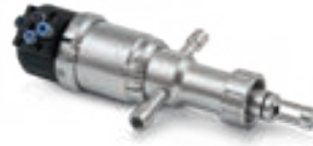
SENSOFIT RAM 5830 For hygienic applications in the food, beverage and pharmaceutical industry