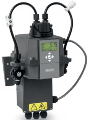
OPTISYS TUR 1060 Optical turbidity measuring system for potable water applications