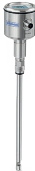
OPTISYS TSS 2050/4050 For hygienic applications, process connection PG 13.5 for use in retractable assemblies

Several G1/2" process adapters and welding sleeves are available like Varivent®, Triclamp, Dairy screw DIN 11851