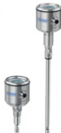
OPTISYS TSS x050