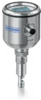
OPTISYS TSS 1050/3050 For hygienic applications, process connection G1/2

Several G1/2" process adapters and welding sleeves are available like Varivent®, Triclamp, Dairy screw DIN 11851