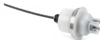
OPTISENS TSS 7000