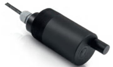
OPTISENS ODO 2000

OPTISENS ODO 2000's use of the optical principle with a fluorescent dye on the inner side of the oxygen permeable membrane means there is no need of recalibration parts. Precision and reliability remain constant.