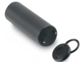
Luminophore disc with mounting tool

OPTISENS ODO 2000 measures dissolved oxygen concentration in an aeration at a wastewater treatment plant, Stuttgart, Germany