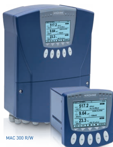
MAC 300 R/W