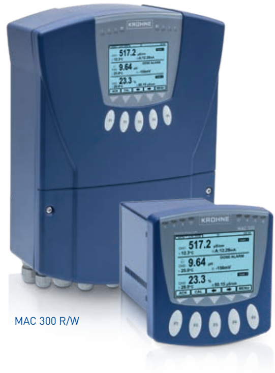
MAC 300 R/W